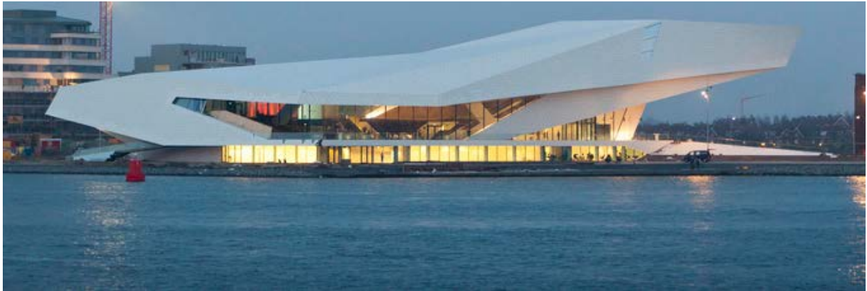
EYE, Amsterdam, Nederland

Donderdag en vrijdag 12 & 13 november 2015