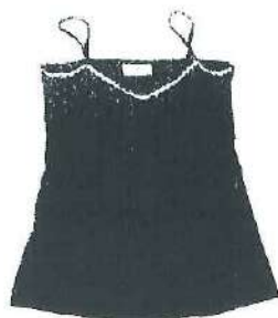
Top CABBAGE WTG