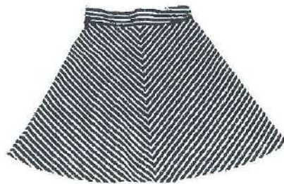
Rok POEDEL WTG