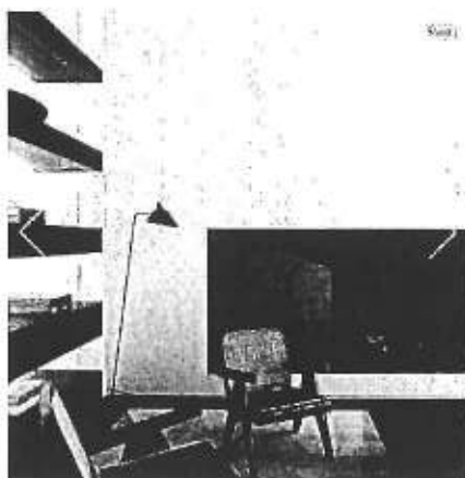
bibliotheek en haard

10. Het keukenmodel wordt, volgens eisende partijen, verwerkt in een totaalproject en daarbij gecombineerd met een bibliotheek, een open haard en een verlichtingselement.